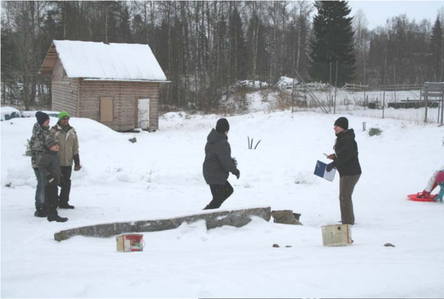
Joulu Tohnimäen talolla 2010